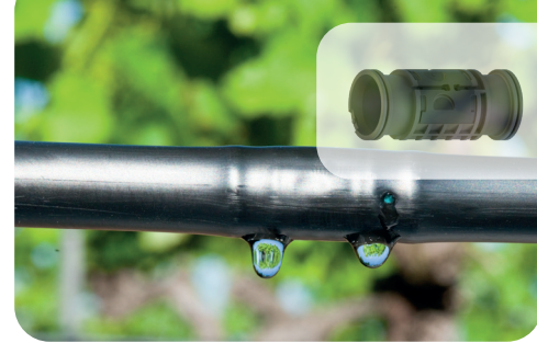
HYDRO PC Gamme confort