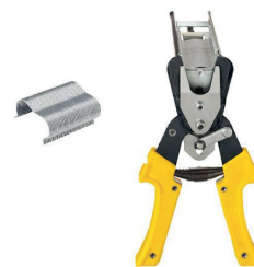
Agrafes et Agrafeuse