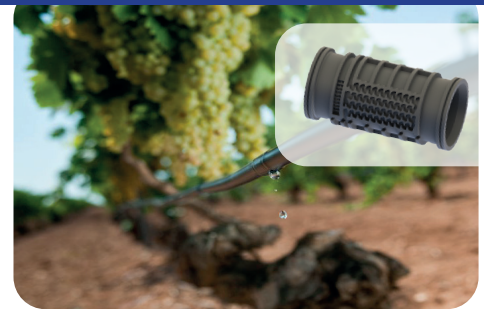
HYDROGOL Gamme tranquillité