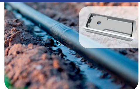
FLOWIN PC 1.6 et PCAS Gamme tranquillité