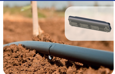
D5000 AS Gamme confort